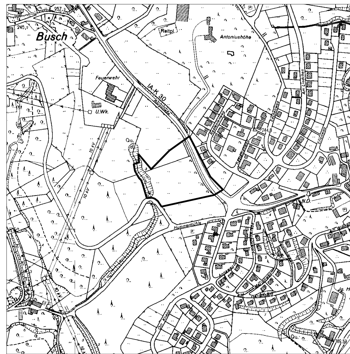
Übersicht M. 1:5000

Entlang der südlich des Flurstücks 37 gelegenen öffentlichen Verkehrsfläche ist als Einfriedigung ein Sichtschutz bis zu einer Höhe von 2,0 m zulässig.