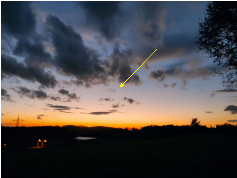
Abb. 3 Blick vom Waldrand in westlicher Blickrichtung mit Markierung eines Fledermausexemplars im Flug