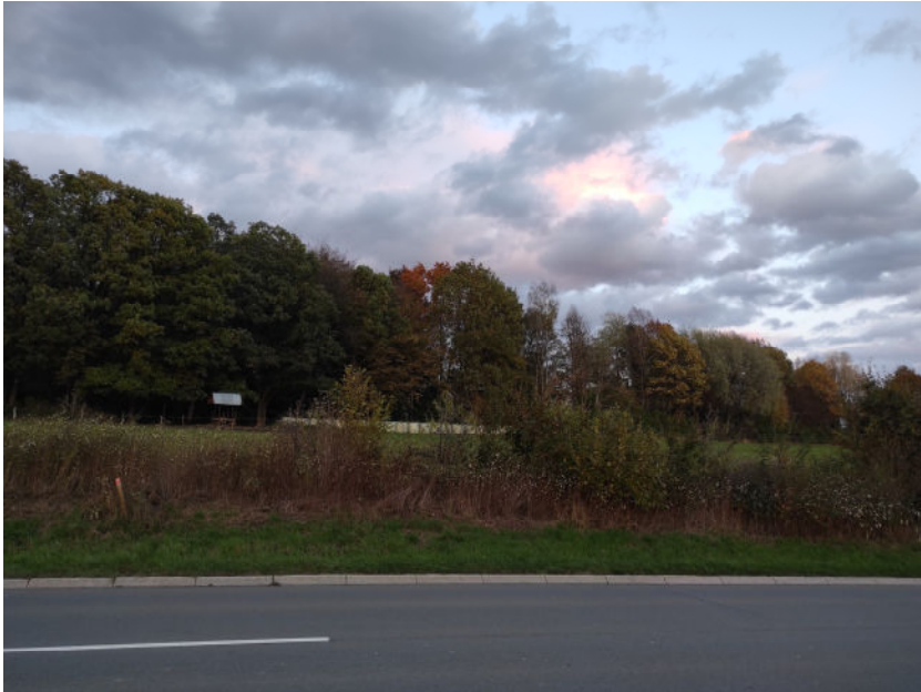
Abb. 2 Waldrand an der nordöstlichen Plangebietsgrenze

Das relativ kleine Tier bewegte sich dabei vorzugsweise und auf wiederholten Flugrouten im Luftraum (ca. 3 bis 5 m Höhe) in direkter Nähe des Wald- bzw. Gehölzrandes. Die windstilleren Bereiche östlich der Baumhecke in Richtung des Hofes „Antoniushöhe“ wurden dabei auch aufgesucht. Teilweise war das beobachtete Exemplar aber auch außerhalb der Kronentraufbereiche unterwegs. In dem für Zwergfledermäuse typischen „hektischen“ Flug jagte das Tier in der Nähe des Waldrandes bis ca. 1 m über der Grünlandfläche nach Insekten.