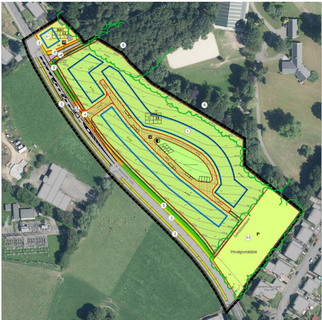
Abb. 1 Bestands- und Konfliktplan (Landschaftspflegerischer Begleitplan, Ingenieurbüro + Landschaftsarchitektur Haacken, Stand 14.07.2020 – Verkleinerung ohne Maßstab)

Die Erschließungsgesellschaft mbH der Gemeinde Kürten beabsichtigt auf ca. 2,81 ha einer überwiegend als Weideland genutzten Fläche nordöstlich entlang der Bergstraße (K 30) zwischen den Ortsteilen Kürten und Busch ein Wohngebiet zu entwickeln. Dazu befindet sich der Bebauungsplan 109 „Auf der Brache“ zur Zeit in Aufstellung. Durch das Planvorhaben werden eine vorhandene Grünlandfläche und teilweise der straßenbegleitende Bewuchs an der K 30 in Anspruch genommen. Der angrenzende Waldrand wird nicht berührt.